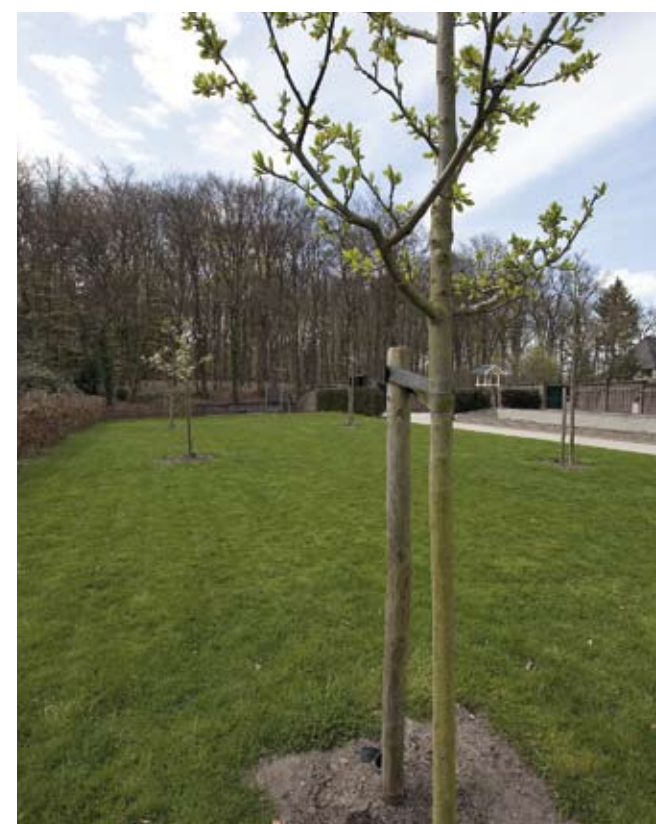
Op de plaats van de vroegere moestuin is een hoogstamboomgaard aangeplant met appels ('Bramley's Seedling', Sterappel, 'Groninger Kroon', 'James Grieve', 'Glorie van Holland'), peren ('Beurré Alexandre Lucas', 'Gieser Wildeman', 'Zoete Brederode', 'Williams') en pruimen ('Reine Claude d'Althan', 'Reine Claude d'Oullins'). Tussen de bomen komen kunstwerken op sokkels te staan.