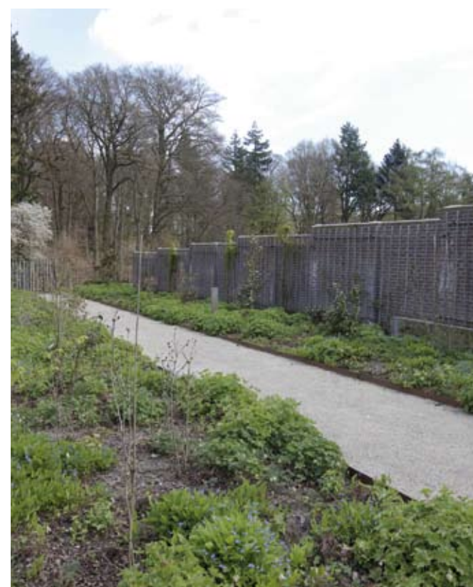
De Camellialaan met onder andere Camellia 'Winter's Joy', 'Brushfield's Yellow', 'Donation' en 'Spring Festival' in een onderbeplanting van Geranium macrorrhizum 'Spessart', Omphalodes verna en Dicentra formosa 'Langtrees'.