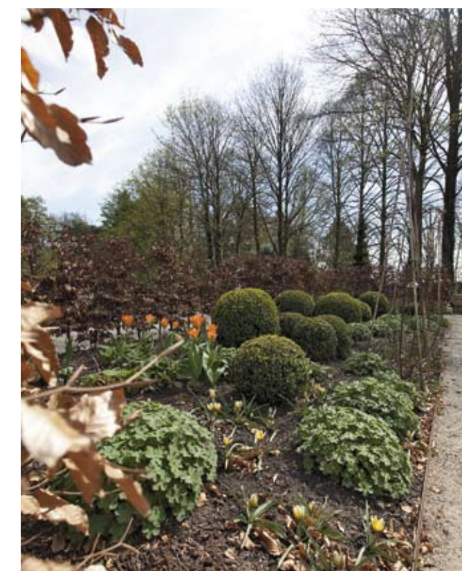
Elke tuinkamer heeft een eigen sfeer en thema. In de geurende tuinkamer zijn het vooral de rozen 'Golden Celebration', 'Evelyn', 'Just Joey' en 'Golden Showers' die samen met eenjarige heliotroop voor een aangename reuk zorgen. Daarnaast zijn als vaste planten o.a. Cephalaria gigantea en Geranium 'Terre Franche' geplant. De oranje tulpen zijn 'Prinses Irene', de gele botanische op de voorgrond: Tulipa tarda .