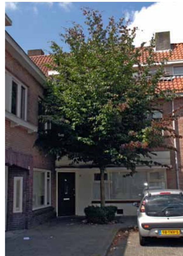
Op sommige plekken op het plein in Eindhoven heerst een warm microklimaat. Hier voelt Parrotia zich prima thuis. Foto 2012.