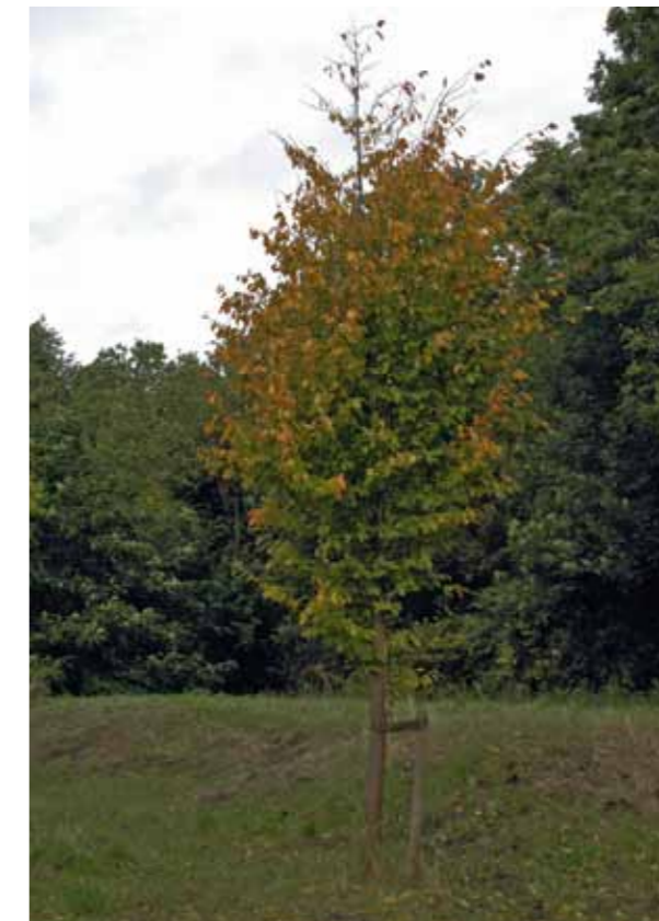
Amsterdam oktober 2012. Parrotia heeft mooie herfstkleuren variërend van geel tot dieppaars.