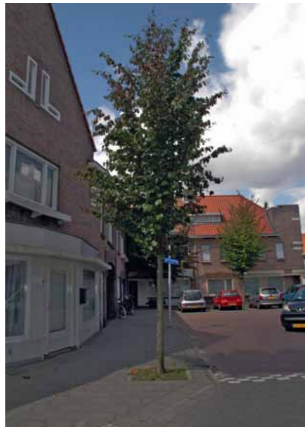
Eindhoven 2012. De bomen op het plein, ontwikkelen zich erg verschillend. Deze boom, op een vrij open plek, is nog vrij smal.

In Zundert (schrале zandgrond) ontwikkelden de bomen zich traag. Na overplaatsing naar Amsterdam-Osdrorp sloegen ze goed aan. In Utrecht stonden de bomen in een grasstrook.