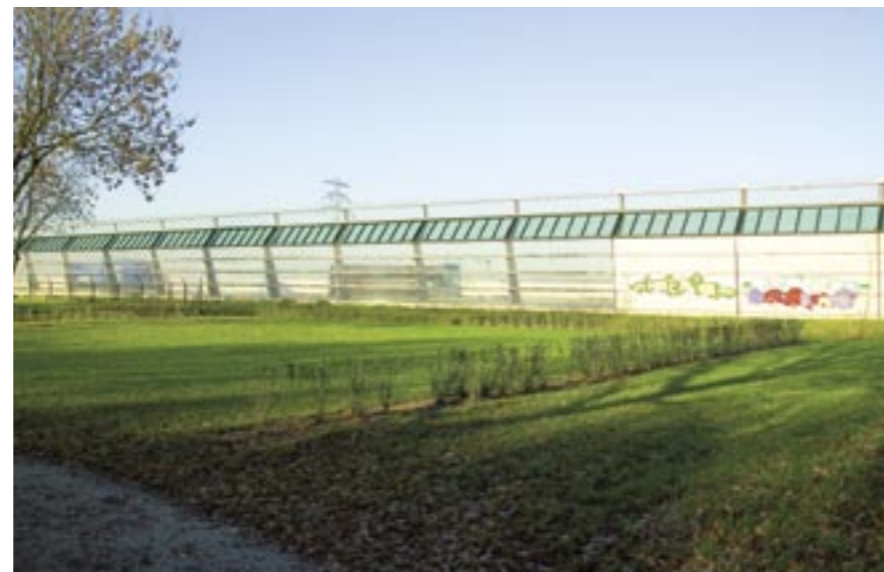
Graffiti mag hier op de geluidsmuur. Voor het glazen gedeelte ligt een grasveld waar de bewoners kunnen picknicken en ondertussen kunnen kijken naar het voorbijgaande verkeer.