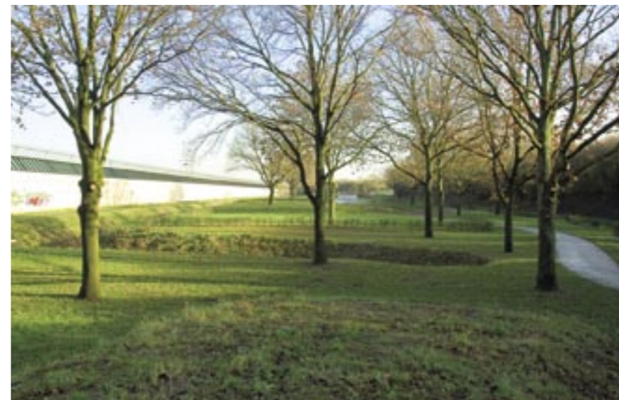
Om geld te besparen is de grond niet afgevoerd maar gebruikt om reliëf aan te brengen in het park. Deze grondlichamen en de hagenstructuur delen het park in kamers in.

satie van het park mager is, moest de ontwerper goed nadenken over de inrichting. Centrale vraag daarbij was: hoe krijg ik een groot effect met weinig middelen?