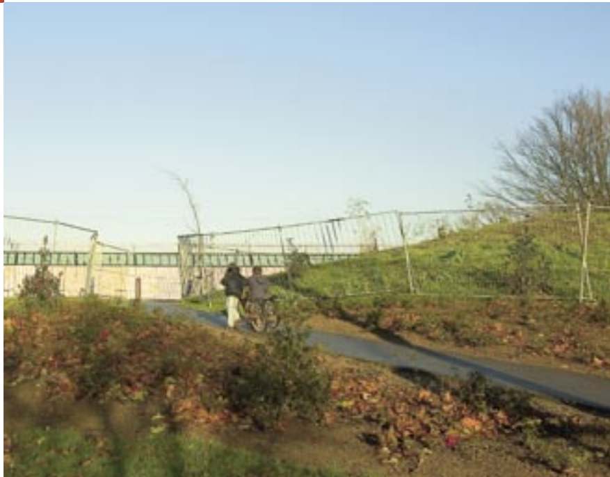
De entree van het park, een opening in de oude geluidswal, wordt geaccentueerd door bloeiende miniatuurroosjes Rosa 'Noare' ALCANTARA. Het toegangspad loopt iets omhoog wat de nieuwsgierigheid prikkelt om het park binnen te gaan. In de toekomst zullen de vijf treurwilgen (Salix sepulcralis 'Chrysocoma') een hangende muur vormen waar je onderdoor loopt om het park te betreden.