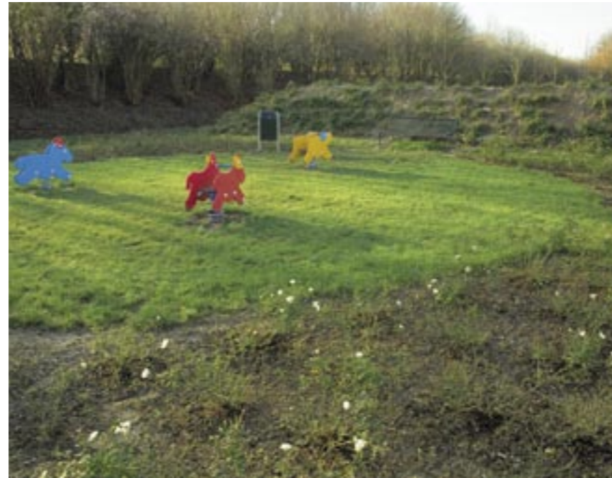
De speelplek voor de kleinsten. Door een wal aan te leggen beplant met miniatuurroosjes (Rosa 'Noare' ALCANTARA en Rosa 'Noaschnee' SCHNEEFLOCKE) is een kleine wereld gemaakt.