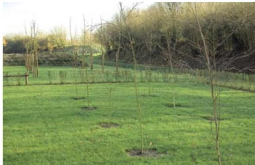
Het berkenbos wordt omgeven door een haag van liguster ( Ligustrum vulgare 'Atrovirens'). In de daarachtergelegen boomgaard staan onder andere Prunus avium 'Varikse Zwarte', Pyrus communis 'Conference' en Malus domestica 'Elstar'. Parkbezoekers mogen het fruit plukken.